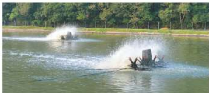
ETE - Localizada na Rua Francisco Sartori, em Herval d' Oeste.

A ETE Herval d'Oeste trata o esgoto coletado nos municípios de Joaçaba e Herval d'Oeste. O tratamento inicia com uma unidade de pré-tratamento, que visa a remoção dos sólidos mais grosseiros que chegam com o efluente bruto. Posteriormente o efluente passa por duas lagoas aeradas facultativas, onde o tratamento ocorre pela ação de microrganismos predominantemente aeróbios, seguidas de uma lagoa de maturação que tem por objetivo a remoção de organismos patogênicos.