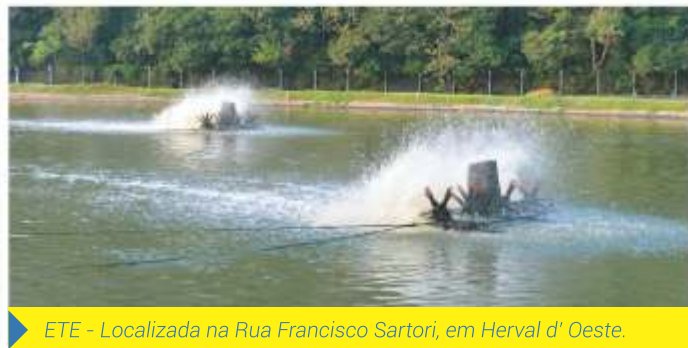
ETE - Localizada na Rua Francisco Sartori, em Herval d' Oeste.

A ETE Herval d'Oeste trata o esgoto coletado nos municípios de Joaçaba e Herval d'Oeste. O tratamento inicia com uma unidade de pré-tratamento, que visa a remoção dos sólidos mais grosseiros que chegam com o efluente bruto. Posteriormente o efluente passa por duas lagoas aeradas facultativas, onde o tratamento ocorre pela ação de microrganismos predominantemente aeróbios, seguidas de uma lagoa de maturação que tem por objetivo a remoção de organismos patogênicos.