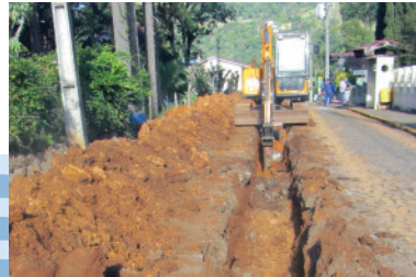
Implantação de rede coletora