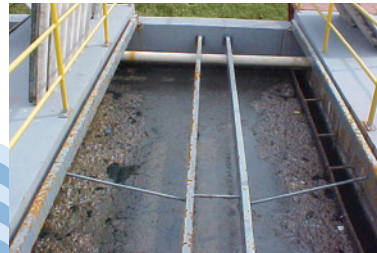
Estação de tratamento de esgoto