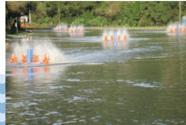
Estação de tratamento de esgoto

O Simae coleta e trata o esgoto de 62% da área urbana do município de Joaçaba, 82% da área urbana do município de Herval d'Oeste e 95% da área urbana do município de Luzerna. Para aumentar a cobertura de esgotamento sanitário e atender aos Planos Municipais de Saneamento, que prevê a universalização da coleta e tratamento de esgoto sanitário até 2030. Para atender 100% da população urbana é necessário um investimento de grande monta, para isso parte dos recursos arrecadados é utilizado para expansão e melhorias das redes de esgoto.