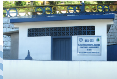
Elevatória de esgoto