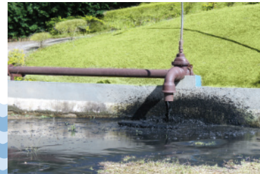
Estação de tratamento de esgoto

Além disso, o usuário que destina inadequadamente seu esgoto gera uma série de transtornos ao Simae, pois há materiais que acabam passando pela peneira e muitas vezes ficam retidos no rotor da bomba fazendo com que este pare de funcionar, necessitando efetuar manutenção ou a substituição do conjunto motorbomba.