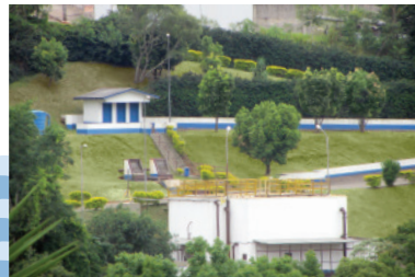
Estação de tratamento de esgoto