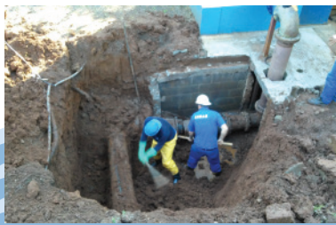
Manutenção de adutora de recalque

Amostras de esgoto são coletadas e analisadas no laboratório do Simae e semestralmente, através de empresa contratada, que realiza a coleta e análise do esgoto, inclusive da água do rio antes e depois da saída das ETEs, para verificar o atendimento às legislações ambientais.