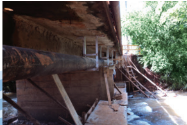
Rede de esgoto

O esgoto de seu imóvel, gerado a partir do momento que você abre a torneira da pia, dá descarga, lava roupas, toma banho, enfim todas as águas servidas, necessita de infraestrutura para chegar até a estação de tratamento. Essa estrutura é composta de redes, poços de visita, elevatórias, estação para tratamento de esgoto.