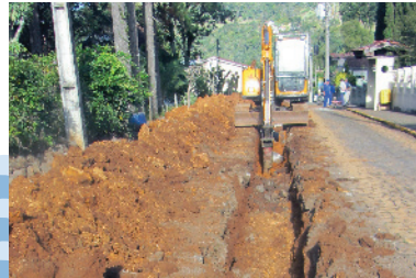
Implantação de rede coletora